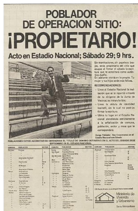
Fig. 3 "¡PROPIETARIO!" Publicidad del evento en el diario La Tercera.

La investigadora ha centrado su análisis en el punto de inflexión de las políticas segregadoras en Chile que estuvieron marcadas por un evento concreto. El día 29 de septiembre de 1979 en el Estadio Nacional, luego de una gran campaña publicitaria, el Ministerio de Vivienda y Urbanismo convocó a 37 mil familias pobladoras para otorgarles títulos de dominios pe en un lugar predeterminado de la periferia bajo la condición de un ahorro y pago de cuotas, todo dentro de una lógica de privatización del suelo y de construcción de viviendas.